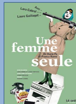
2008 : Une femme seule , de Dario Fo et Franca Rame