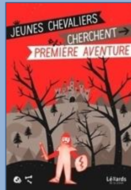
2012 : Jeunes chevaliers cherchent première aventure , d'après les Romans de la Table Ronde de Chrétien de Troyes