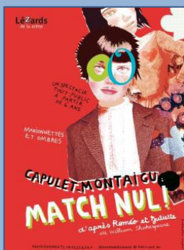
2009 : Capulet-Montaignu : match nul ! d'après Roméo et Juliette de William Shakespeare